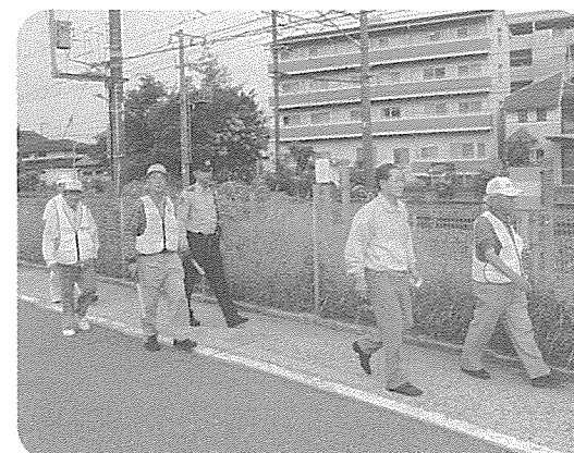
JR沿いをパトロール

防犯パトロールの目的は「犯罪・事故・災害の被害を未然に防止すること」「地域住民の防犯意識を高めること」「地域の連帯感を醸成して犯罪抑止機能を向上させること」「危険箇所を点検して改善すること」などです。